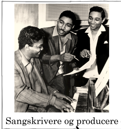
Sangskrivere og producere