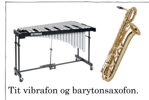
Tit vibrafon og barytonsaxofon.