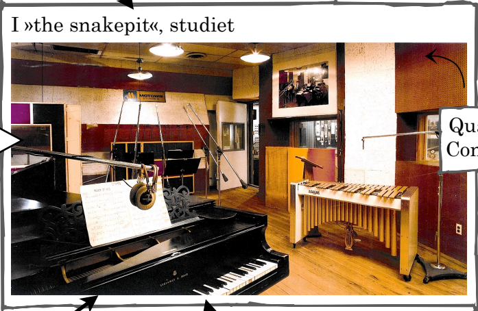
I »the snakepit«, studiet