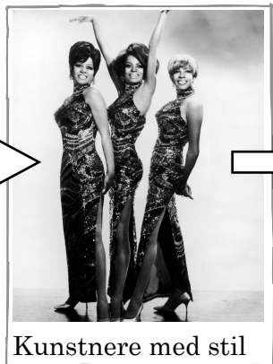
Kunstnere med stil

Charm school. Styling, danselektioner, manerer