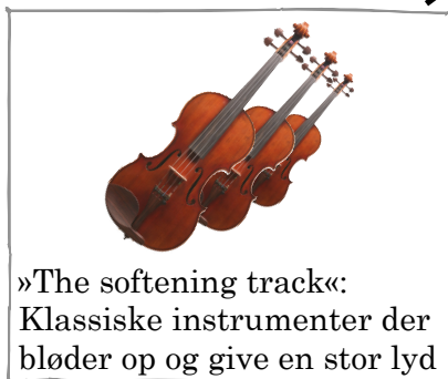
»The softening track«: Klassiske instrumenter der bløder op og give en stor lyd